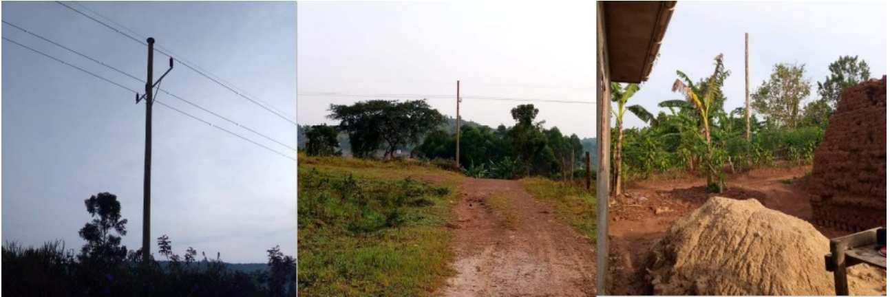
Elstolpar som leder till centret som kan användas av närliggande hus.