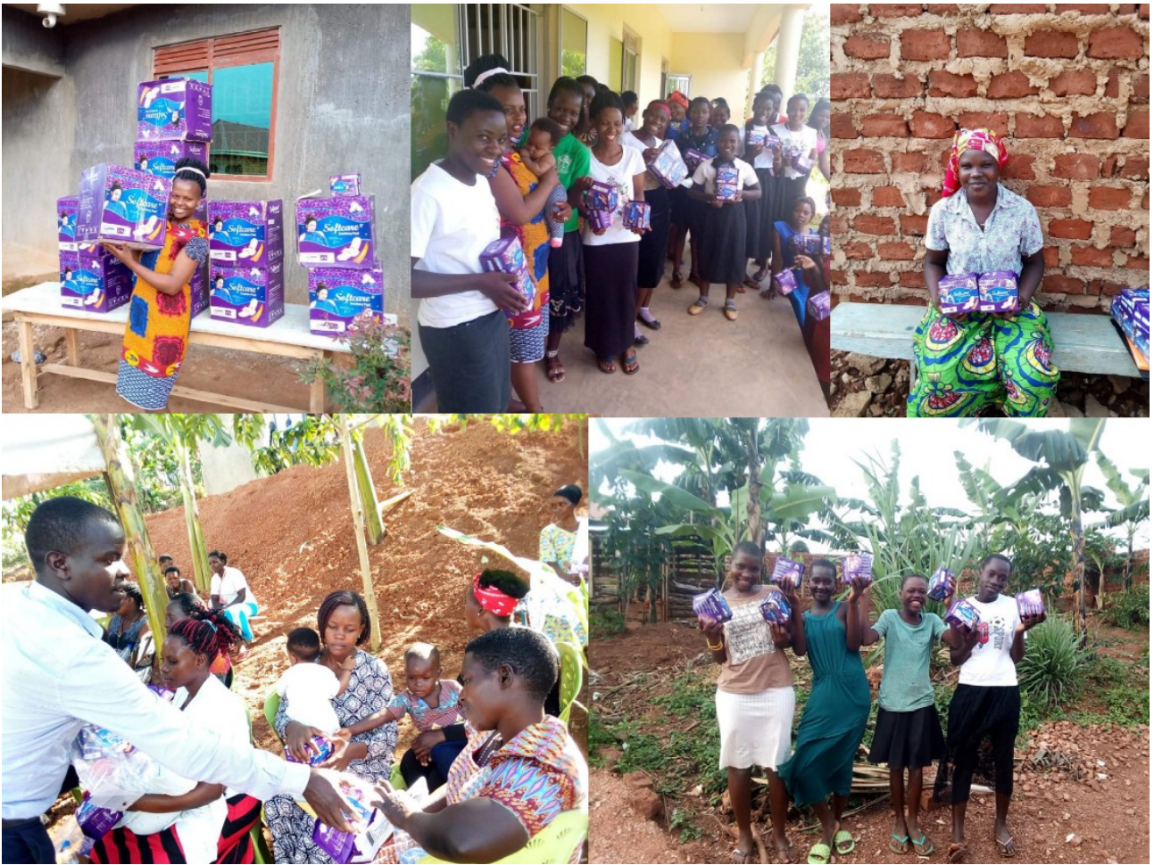
Utdelning av bindor.